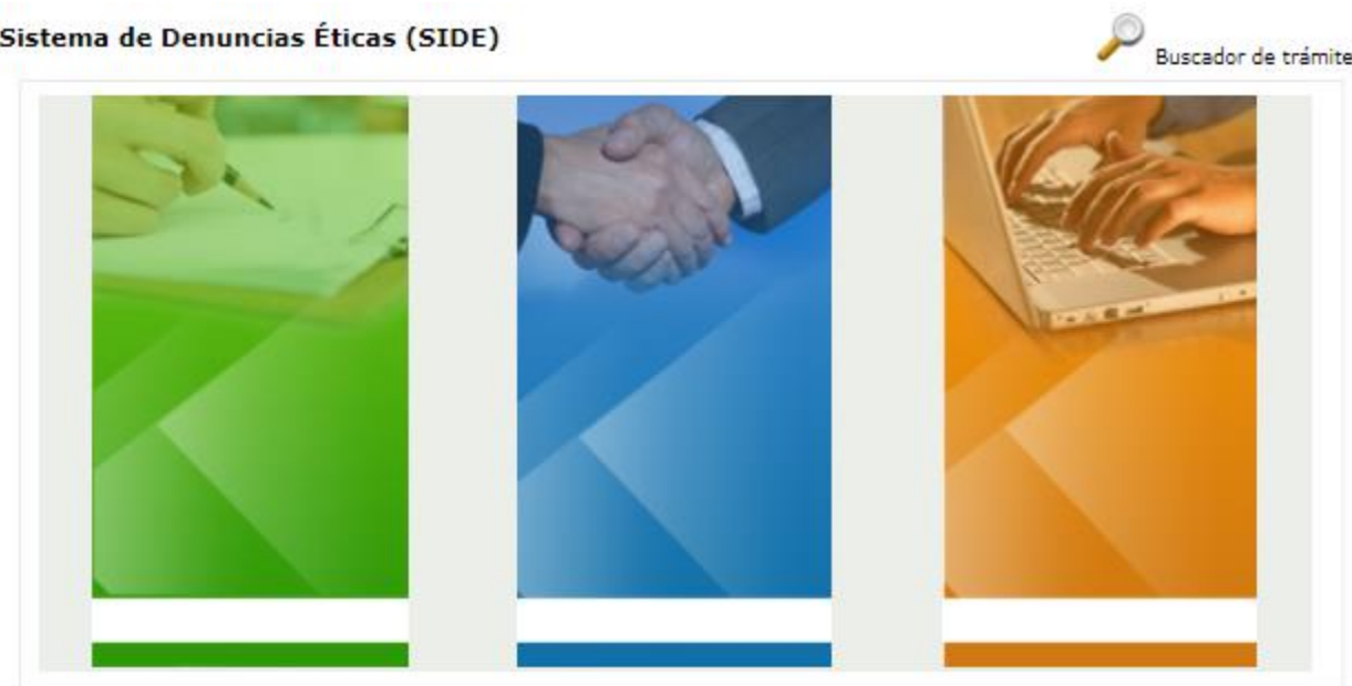
Sistema de Denuncias Éticas (SIDE)