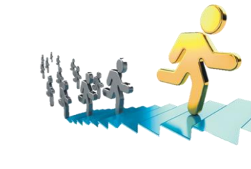
Competencia por mérito