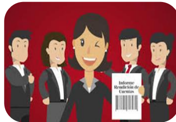
Rendición de Cuentas